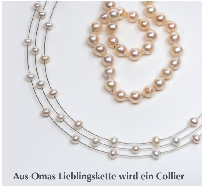
Aus Omas Lieblingskette wird ein Collier

aus Ihrem Familienschmuck gestalten wir tragbaren, modernen Schmuck.