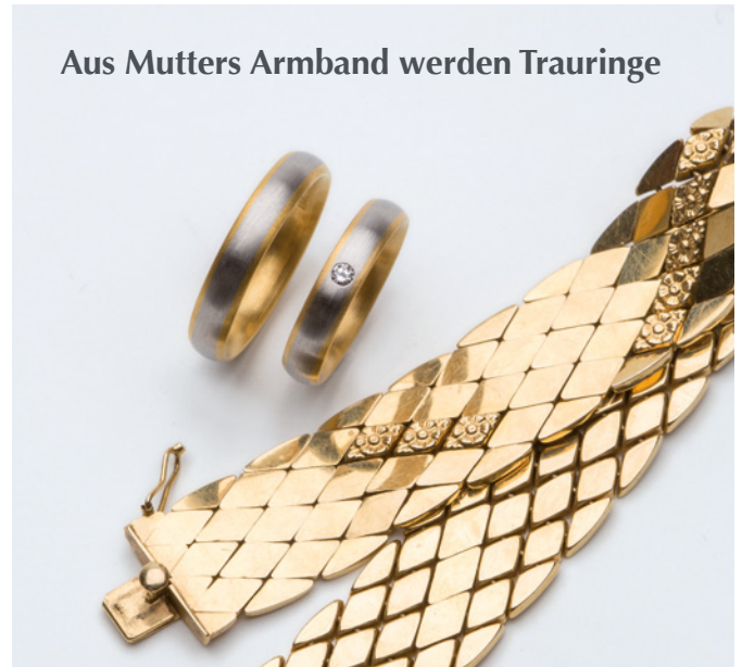
Aus Mutters Armband werden Trauringe