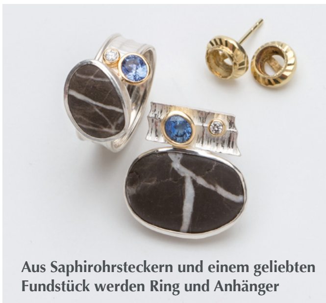
Aus Saphirohrsteckern und einem geliebten Fundstück werden Ring und Anhänger